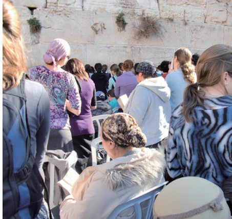
エルサレムの「嘆きの壁」

覇権というよりは、もっと個人のレベルで一歩も退かないテクノロジーが街を自由に闊歩し始めているのだ。特にAIはその分野で、最も社会への影響度が大きく、最も影響へのコントロールが困難なもの