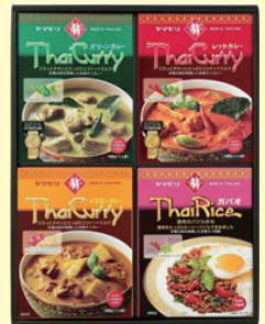
ヤマモリ株式会社様 【タイフード満喫ギフト】